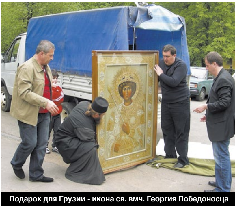
Подарок для Грузии - икона св. вмч. Георгия Победоносца

украстит грузино-осетинский храм во имя святого великомученика и Победоносца Георгия, который они строят неподалеку от монастыря, где служил преподобный Гавриил (Ургебадзе) – современный грузинский святой. Службы в нем будут совершаться на грузинском и осетинском языках. Братья пригласили нас на освящение храма по окончании его строительства.