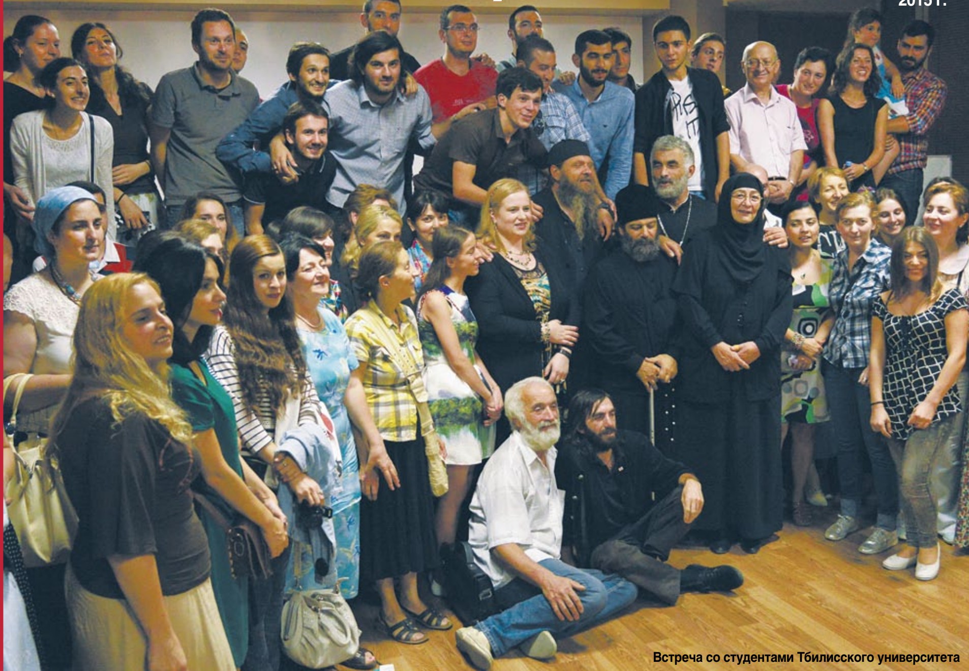
Встреча со студентами Тбилисского университета