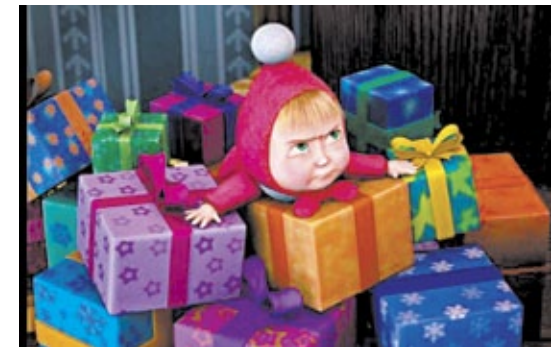
Две Машеньки: одна - героиня современного мультфильма, другая - русской народной сказки.

На фоне веселого и увлекательного действия отчетливо проявляется суть взаимоотношений взрослого и ребенка. Какие же отношения ставят в пример современному зрителю создатели фильма? Показано типичное поведение избалованного ребенка-эгоиста «без ограничений и рамок», где его родители являются только инструментом для добычи игрушек и развлечений. Девочка «стоит на ушах»: прыгает на постели в незнакомом доме, мешает спать взрослому, мешает заниматься делами, требует постоянных игр и развлечений, никакой созидательной деятельности, никакой помощи взрослому, никакого уважения.