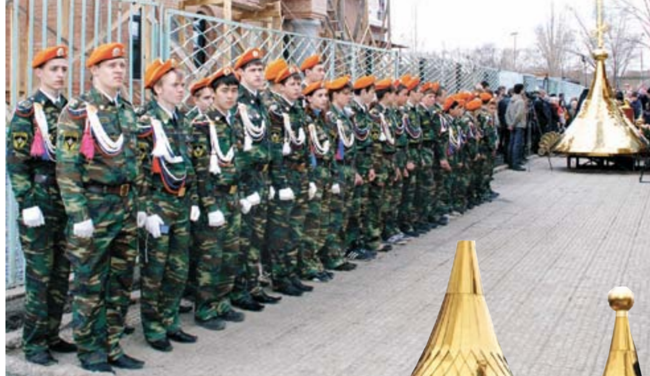
Окончание. Начало на 1-й стр.

Как-то в одной железнодорожной поездке попутчиками оказалась молодая пара с маленьким сыном. За окном мелькала летняя зелень полей, лесов. Неожиданно раздался радостный крик мальчика: «Мама, мама! Смотри! Что это? Золотая звезда в деревьях!» Пассажиры прильнули к окнам. А там, в дали зеленого массива горел золотом купол храма. И так сверкал на солнце, что и вправду от него исходили длинные лучи в разные стороны. Переливался и напоминал о горнем мире, призывал вспомнить о душе. И так изумил и взволновал ребенка, что тот долго еще не мог отойти от впечатления, все задавал и задавал вопросы.