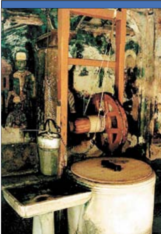
Во времена царствования в Византии императора Андроника II (1282-1328 гг.) Архангелы Михаил и Гавриил чудотворным образом помогли отцам Дохиарского монастыря, явив им источник воды.

На улице, у тротуара, установили столб с фонарем для освещения. Одни люди радовались, что темная часть улицы теперь освещена, и уже никто не оступится в темноте. А другие сердились, говоря: если фонарь погаснет, то уже наверняка можно будет о столб разбить голову. Так обычный столб может радовать одних и огорчать других.