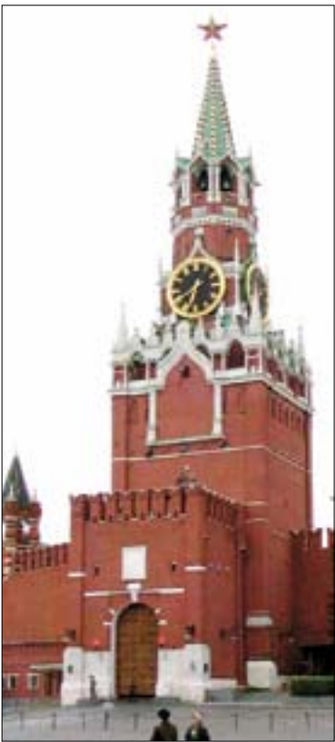
Спасская башня Кремля.

В 1521г. во время осады Москвы войском Магмет Гирея одна инокиня увидела видение: крестный ход через Фроловские ворота со святителями Московским Петром, Алексеем и Ионой и ростовским Леонтием несут икону Владимирской Божией Матери и другие... Преподобные Сергей и Варлаам стали умолять святителей, чтобы они просили Богородицу заступиться за людей. Видение стало известно в народе. И, действительно, вскоре Магмет Гирей, испуганный каким-то чудесным видением, отступил от Москвы. В память этого события были написаны иконы: Спасителя с написавшим к Его ногам преп. Сергием и Варлаамом на восточной стене Спасских ворот и Богоматери с предстоящими Ей святителями моск. Петром и Алексием на западной стене.