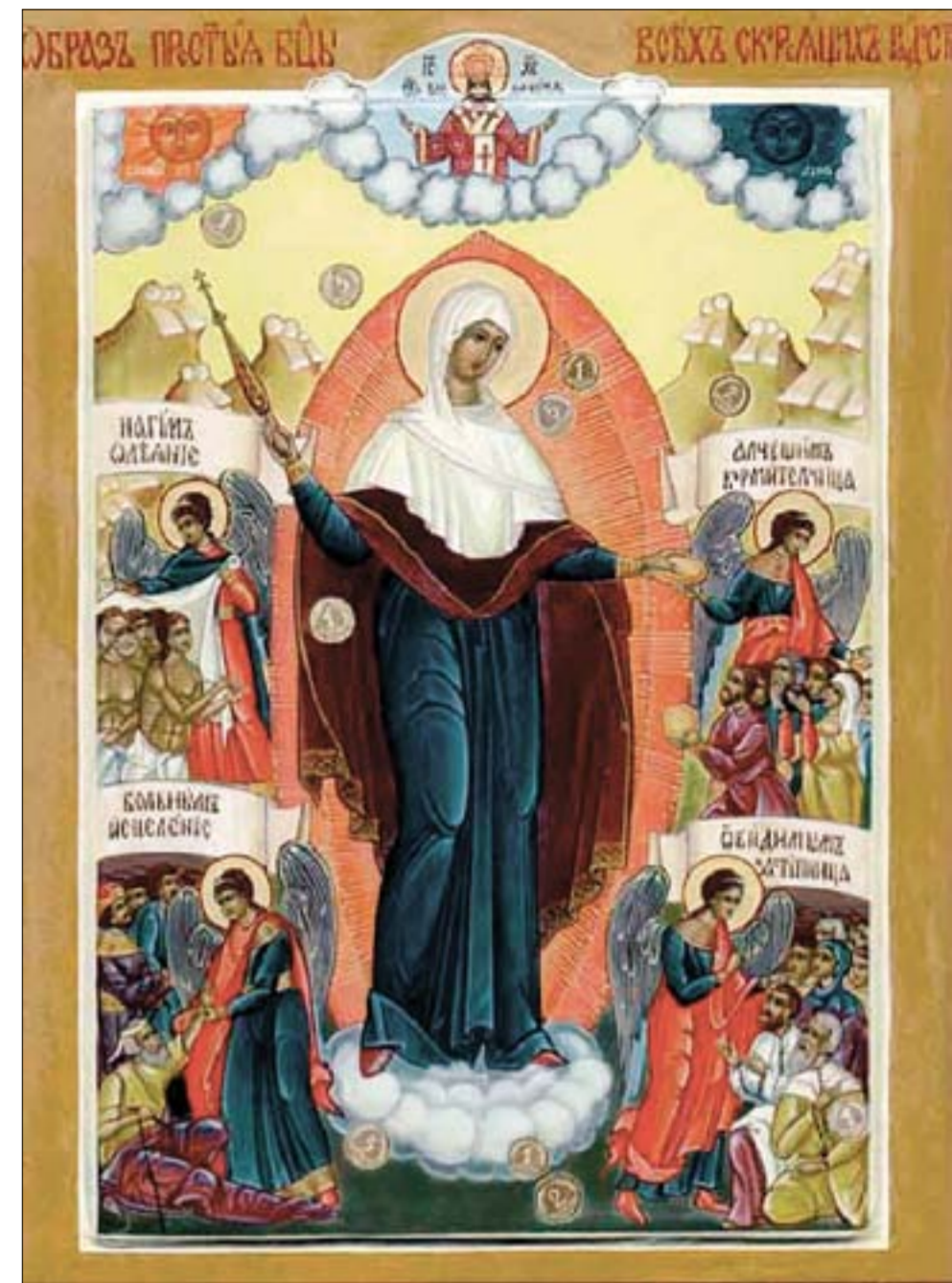
Празднование иконы «Всех Скорбящих Радость» - 6 ноября.

Перед иконой Божией Матери «Всех скорбящих Радость» молятся в отчаянии, скорби, в поиске утешения и защиты, а также при неизлечимых болезнях. Божия Мать «Всех скорбящих Радость» является покровительницей сирот и убогих, обиженных и угнетенных, страждущих и страдающих.