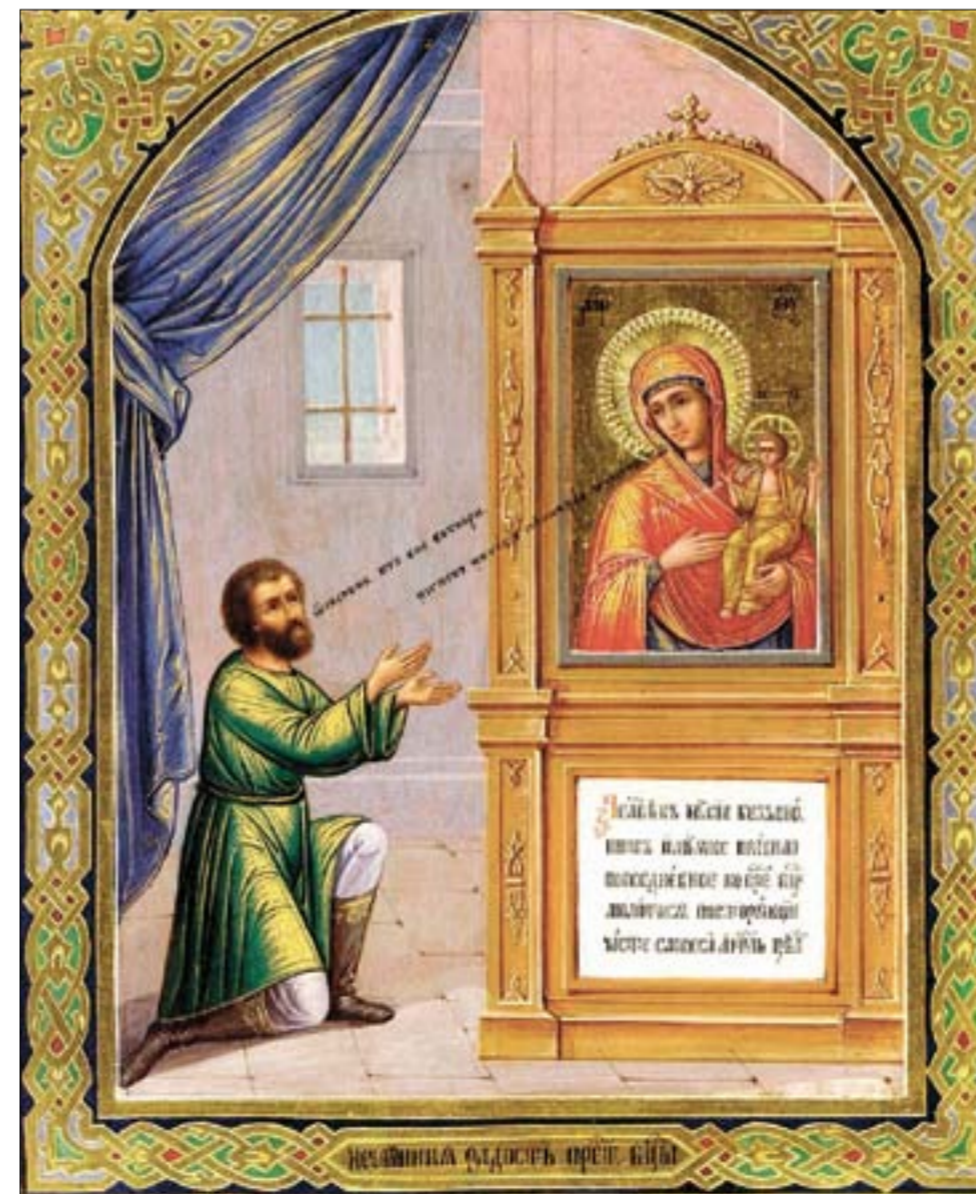
Празднование иконы «Нечаянная Радость» - 14 мая и 22 декабря.

В книге святителя Димитрия Ростовского «Руно Орошенное» есть назидательное повествование об одном грешнике, который получил нежданную духовную радость покаяния от иконы Божией Матери.