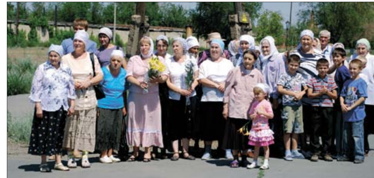
С духовным трепетом, волнением и радостью верующие ожидают прибытия святыни на орскую землю.