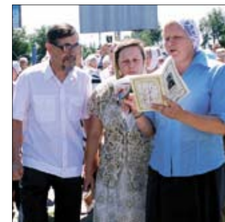
Певчие возносят молебные пения, обращенные к святой Зосиме.

репляют в вере, приносят духовное обновление и ободрение духа, несказанный мир и радость души. О чудесах, явленных от мощей Зосимы, свидетельствует множество золотых украшений в раке святой. Их принесли в дар те, кому она оказала помощь уже в наши дни.