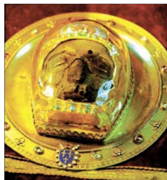
Передняя часть главы святого Иоанна Предтечи в кафедральном соборе г. Амьена.