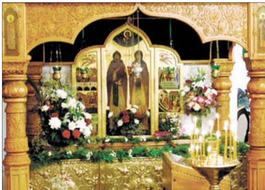
Рака с мощами святых благоверных князей Петра и Февронии Муромских.

Согласно тексту послания епископату Святейшего Патриарха Московского и всея Руси Алексия II, отныне ежегодно 8 июля все епархии и приходы должны праздновать День семьи, любви и верности.