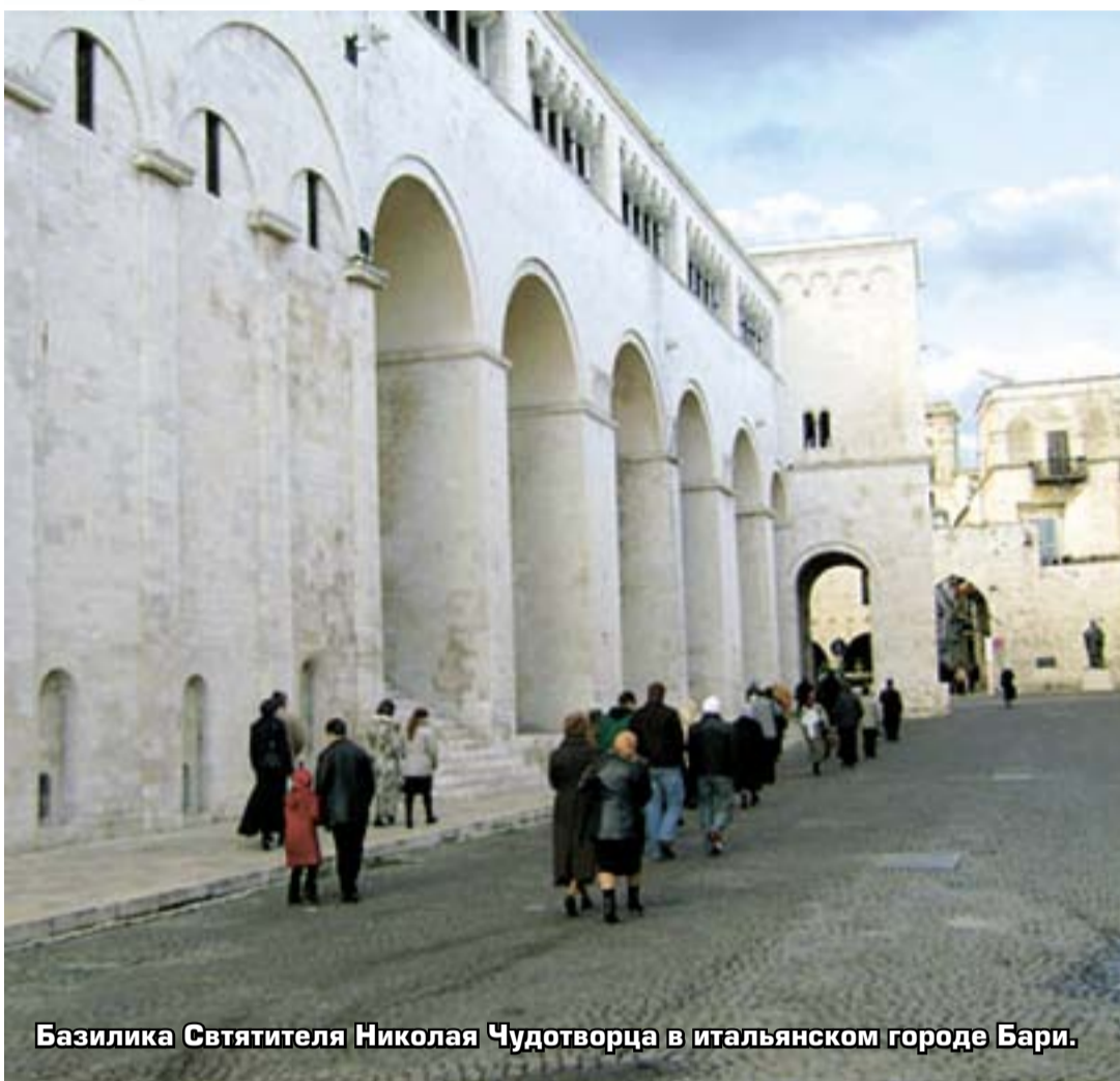
Базилика Святителя Николая Чудотворца в итальянском городе Бари.