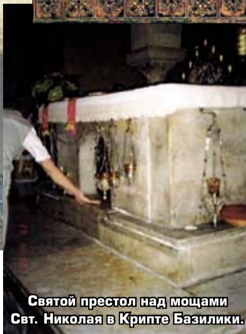
Святой престол над мощами Свт. Николая в Крипте Базилики.