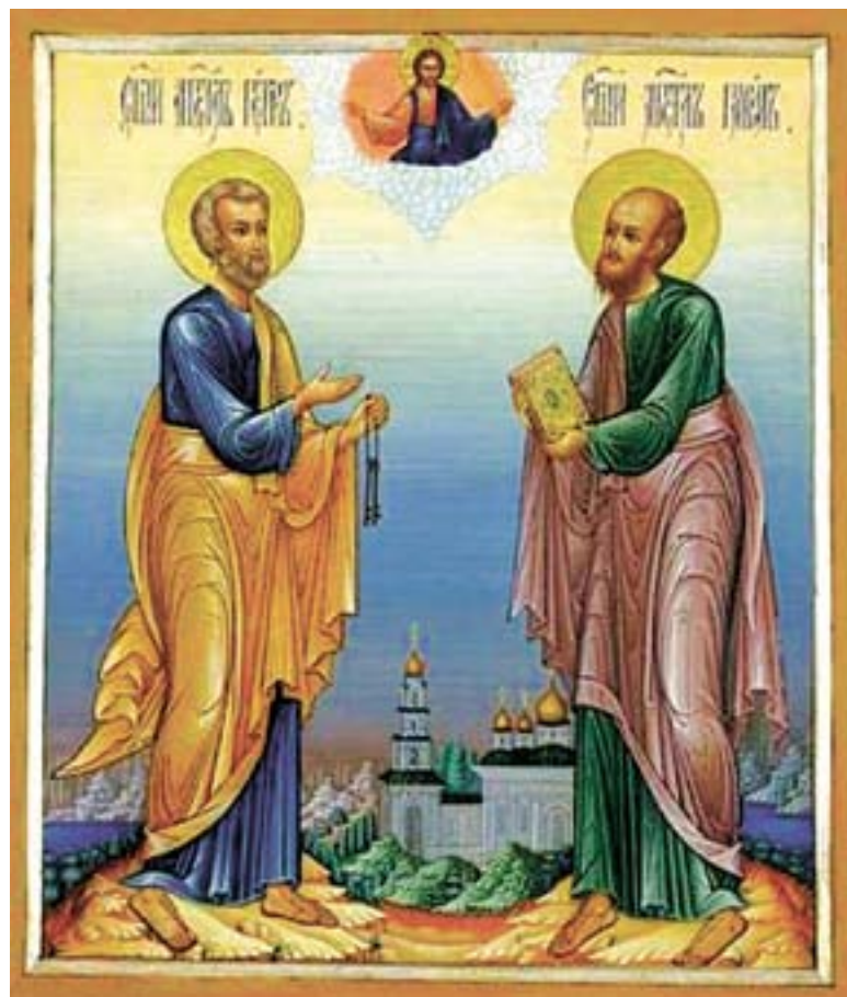
С 19 июня по 11 июля - Петровский пост

Э тот летний пост, который сейчас мы называем Петровым, или апостольским, раньше называли постом Пятидесятницы.