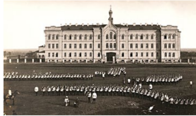
Оренбургская духовная семинария, 1884 г.

В 1883 г. закончилось строительство духовной семинарии и приготовлено было