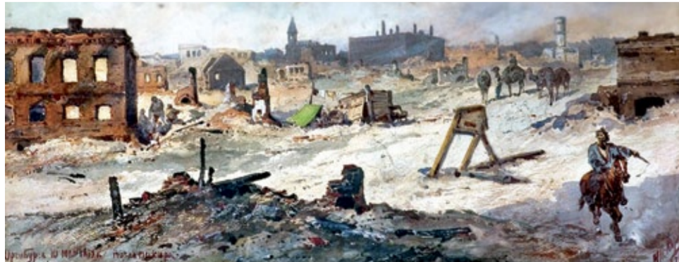
Картина Николая Каразина. «Оренбург, 10 мая 1879 г. после пожара»

Во время пожара, чтобы предотвратить взрыв порохового склада в предместье Оренбурга – Форштадте, на обе стороны крыши склада уложили солдат, и беспрерывно поливали их сверху водой из машин.