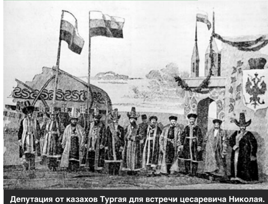
Делегация от казаков Тургай для встречи цесаревича Николая.

Цесаревичу было доложено о желании четырех девушек-казачек поднести пуховые платки собственноручно сделанные, за что их после завтрака одарили по 20 руб. золотом. Конвой из казаков и школьников окружил экипаж Его Высочества и сопровождал Его до Сухой речки, в 10 верстах от поселка.