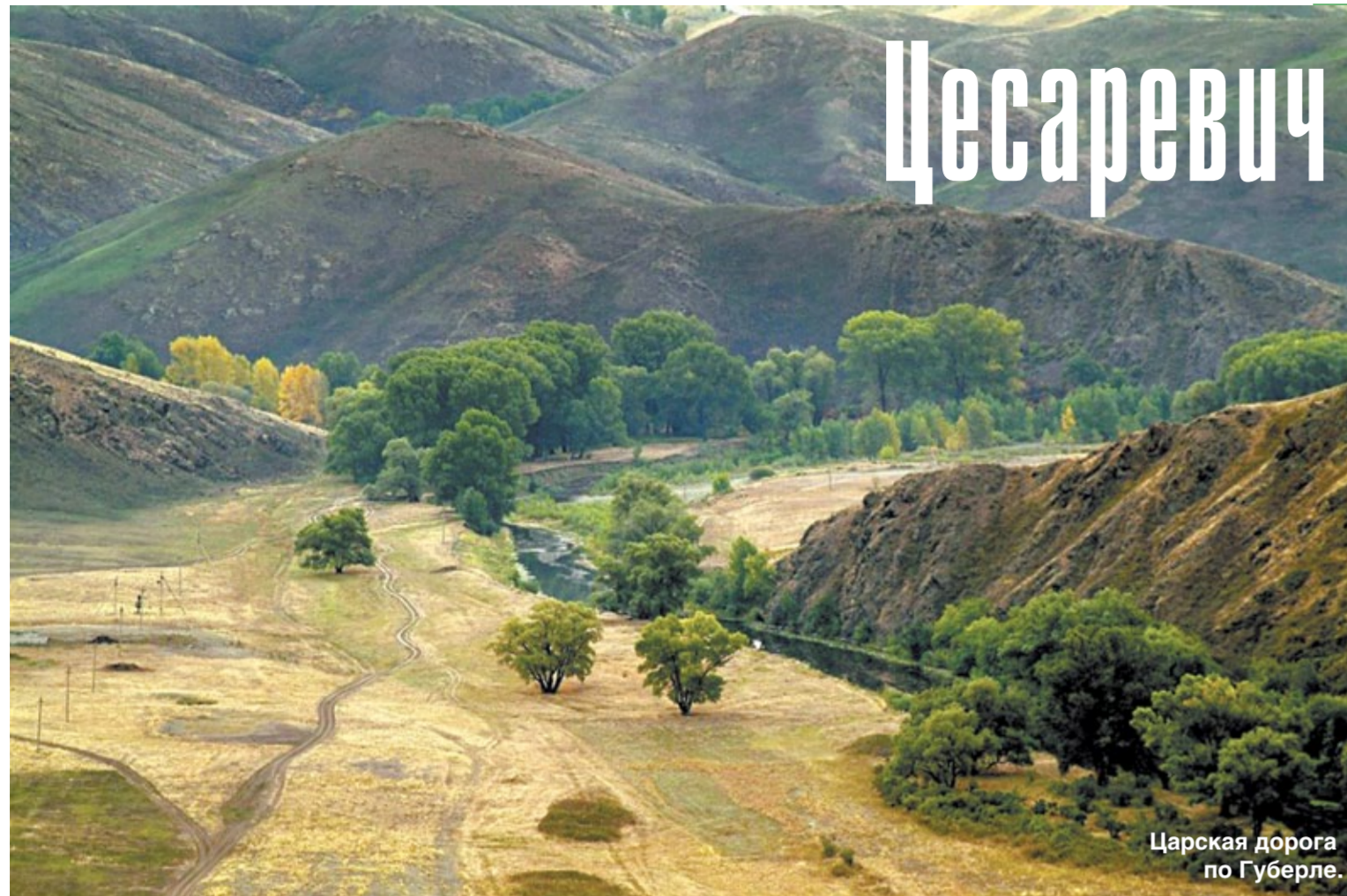
Царская дорога по Губерле.