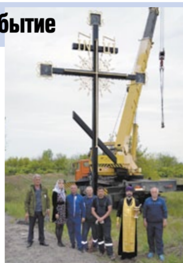
новлен поклонный крест высотой шесть метров.