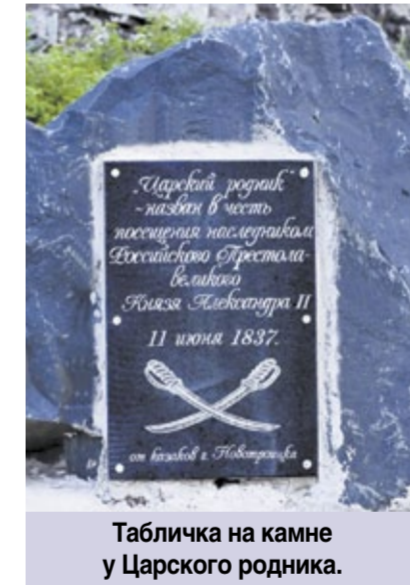
Табличка на камне у Царского родника.

Прихотливыми волнами разместились окрестные горы; издали они представляются в каком-то фантастическом виде: то причудливыми замками из скал с наклонными башнями, то разбросанными в поэтическом беспорядке колоннадами и украшениями фасада каких-то зданий. Между тем, в действительности, все это – лишь камень, мох, кусты, да приземистые березки, растущие в расщелинах и трещинах скал. Зато сколько тут красок и теней, сколько перелива цветов! В горном воздухе чувствуются прохлада и аромат, слышатся несмолкаемое пение птиц и звонкое стрекотание кузнечиков... Как благотворно, смягчающе и вдохновенно влияет на путника окружающая природа, свидетельствует виднеющийся на горе столб с надписями, осененный крестом. На эту гору, объезжая свою епархию в прошлом году, восходил епископ Оренбургский и Уральский Макарий; тут владыка молился и в отрадном молитвенном вдохновении призывал благодать Творца на окрестные горы, осеняя и благословляя их.