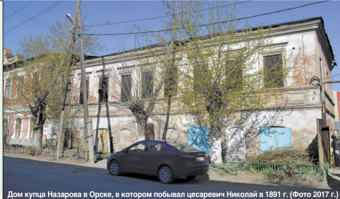
Дом купца Назарова в Орске, в котором побывал цесаревич Николай в 1891 г. (Фото 2017 г.)

Дербисалы Беркимбаев (1839-1919?) жил в местечке Урпия под Орском (40 км), владел несметными отарами овец и табунами лошадей. На Тургайской заводской конюшне (Старая Биофабрика) разводил скаковых лошадей и поставил их к царскому двору. О его богатстве и щедрости ходили легенды. Он устраивал щедрые угощения во время праздников, занимался благотворительностью. В 1891 г. по случаю визита в Орск цесаревича Николая Александровича устроил роскошный прием для будущего царя, устелив дорогу к тургайским конюшням ковровыми дорожками длиной в версту, вдоль которой в два ряда поставил разноцветные войлочные юрты. Будущий Николай II был так поражен великолепным приемом, что подарил Беркимбаеву золотой перстень с царской руки. По приглашению государя Дербисалы присутствовал на торжествах в честь 300-летия дома Романовых. Беркимбаев имел титул внештатного чиновника царского двора по особым поручениям среди казаков Тургай, был аульным судьей, членом Актюбинской уездной комиссии, полковником Русской императорской армии, состоял членом Оренбургского отдела Императорского Географического общества. Награжден двумя золотыми, тремя серебряными и двумя бронзовыми медалями, орденом Станислава II степени.