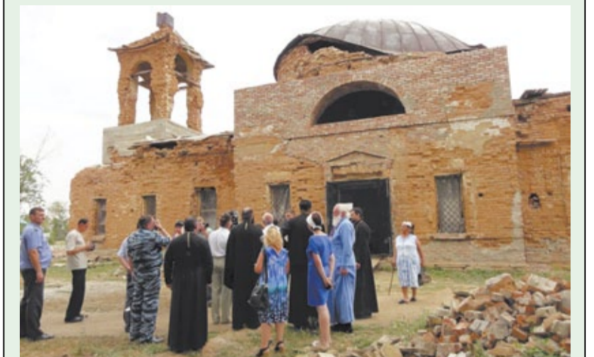
Село Ильинка. Храм пророка Божиего Или (2012 г.).

тем напряженнее. В 4 часа 45 минут по полудни среди глубокой тишины раздался удар церковного колокола. Все обнажили головы, крестясь от радости, что, наконец, Бог привел дожидаться прибытия Августейшего Атамана. Звон участвовал. Конвой взял на караул. Показался конвойный офицер, ехавший впереди, а вслед за ним, в открытом экипаже, Его Высочество.