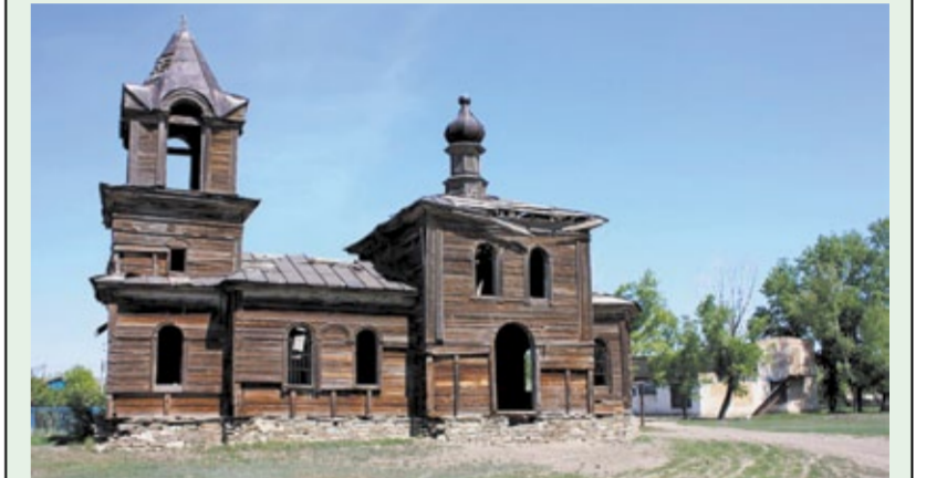
Село Подгорное. Храм в честь Покрова Пресвятой Богородицы.

Никольское, Ильинка, Подгорное – три самобытных села с большой историей. Основаны в 18 веке вдоль реки Урала, они с честью служили южным форпостом Российской Империи. Сюда приезжали царские особы, и тут проходили ожесточенные бои с крестьянской армией Емельяна Пугачева. Во время путешествия по России и Сибири 1837 года эти места посетил цесаревич Александр Николаевич (будущий царь Александр II), а в 1891 году – цесаревич Николай Александрович (будущий царь Николай II). Сегодня в деревнях сохранились уникальные дореволюционные постройки: церкви, мечети и магазины. Храм пророка Божиего Или в селе Ильинка и храм в честь Покрова Пресвятой Богородицы в селе Подгорное являются объектами культурного наследия России, прилагаются множество усилий в деле их восстановления и реставрации.