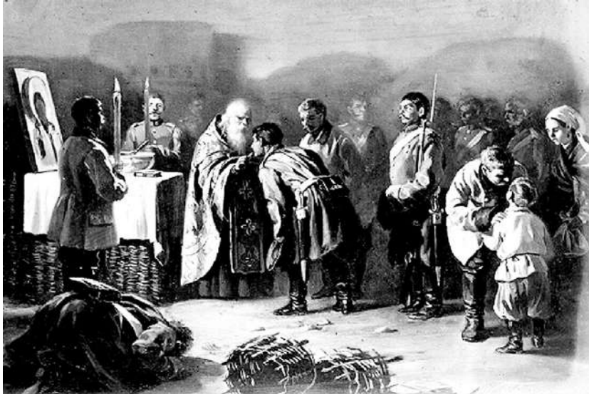
Эпизоды Севастопольской жизни 1854-1855 гг. Пасхальное утро на бастионе. Картина И.М. Прянишникова