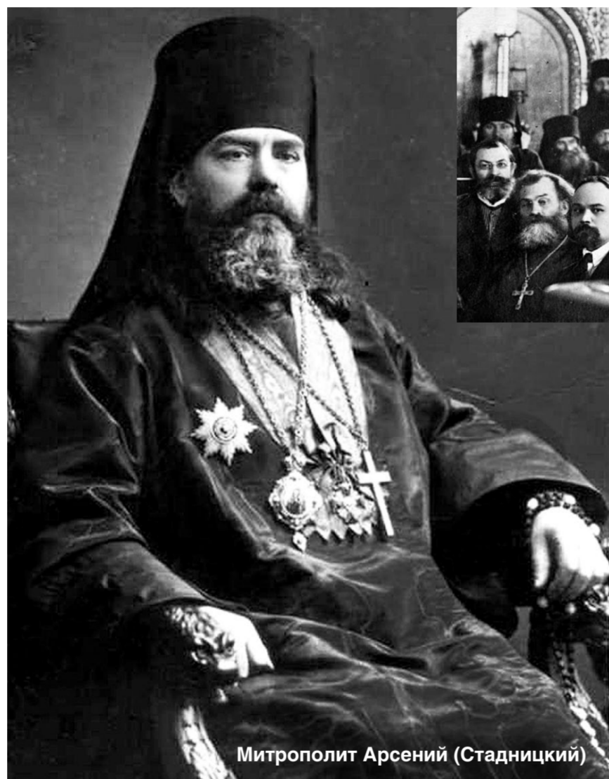
Митрополит Арсений (Стадницкий)

Междоусобная борьба, разделившая наших сынов на два враждебных лагеря вследствие осуждения веры и христианской любви, и подвигла на скорое решение этого вопроса. Всеми сознавалась нужда в одном лице, которое объединило бы нас и было бы нашим духовным вождем. В то время, когда все кругом под-