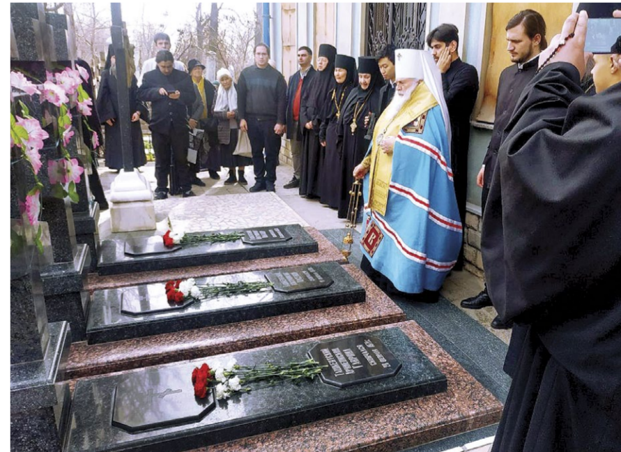
Заупокойная лития на могиле митрополита Арсения, нашедшего свое блаженное упокоение на Боткинском городском кладбище г. Ташкента

Имя митрополита Арсения (Стадницкого) написано золотыми буквами на памятнике почившим профессорам и наставникам Московской духовной академии в Свято-Троицкой Сергиевой лавре.