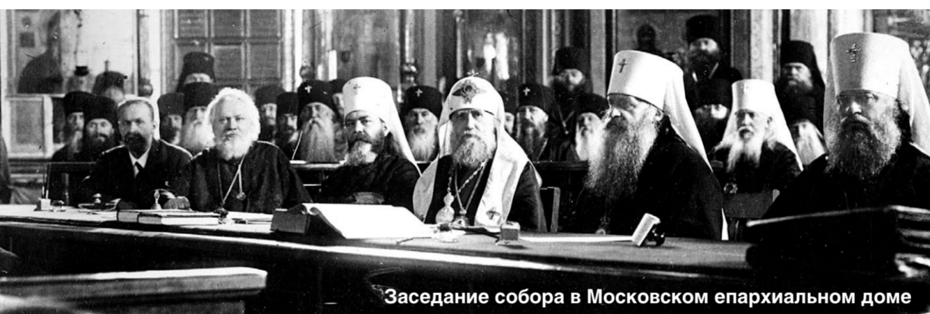
Заседание собора в Московском епархиальном доме

1) католическая система, где Церковь и Государство являются двумя параллельными областями; 2) система древнеримского права, в котором Церковь является лишь частью Государства; 3) система, когда Церковь рассматривается как частное общество (протестантское воззрение);