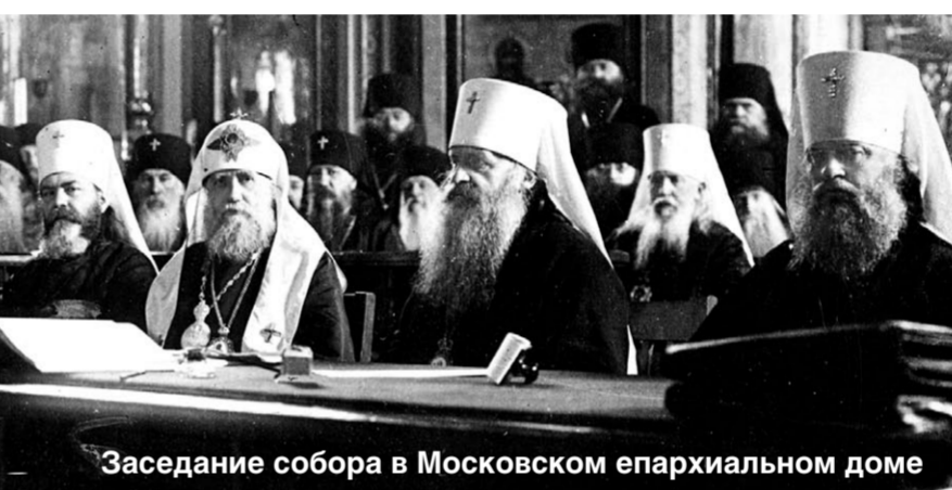
Заседание собора в Московском епархиальном доме