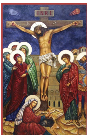
Распятие Иисуса Христа

4. Распятого же за ны при Понтийстем Пилате, и страдавша, и погребенна