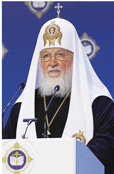
СЛОВО ПАТРИАРХА КИРИЛЛА на пленарном заседании Рождественских чтений (отрывок)

Хотел бы сказать несколько слов о том, о чем подумал во время нашего сегодняшнего заседания. Само слово «вызов» в названии темы Чтений — «Глобальные вызовы современности и духовный выбор человека» не случайно. Что такое вызов? Это не что иное, как предложение, от которого нельзя отказаться. Например, вызов на дуэль: если человек отказывался, он терял свое достоинство, терял уважение в обществе. В контексте той общественной психологии, той морали отказаться от вызова значило потерять самого себя, потерять свое лицо.