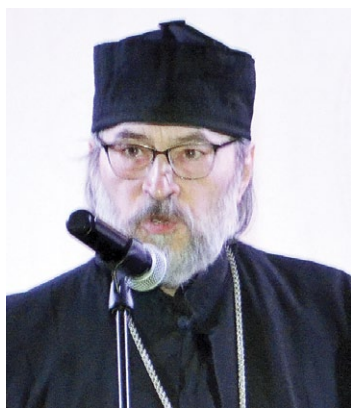
Архимандрит Даниил (Ишматов)