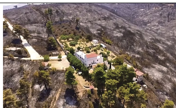
Территория женского монастыря Пресвятой Богородицы Миртидиотиссы, нетронутая огнем, и выжженная земля вокруг.

Печальное зрелище представляла собой местность: обугленная земля, сгоревшие деревья; вся округа – черная от гари и седая от пепла. И среди этого пепелища стоит невредимым белокаменный храм, на стенах которого нет ни единого чёрного пятна. Деревянные скамейки возле храма, деревья – совершенно целые. Удивительно, что земля вокруг храма осыпана сухой листвой, опавшей еще до пожара, но эти листья не опалены. Из-за этого граница нетронутого огнем клочка земли выглядит еще контрастнее. Будто невидимая рука провела черту, оградив обитель Пресвятой Троицы.