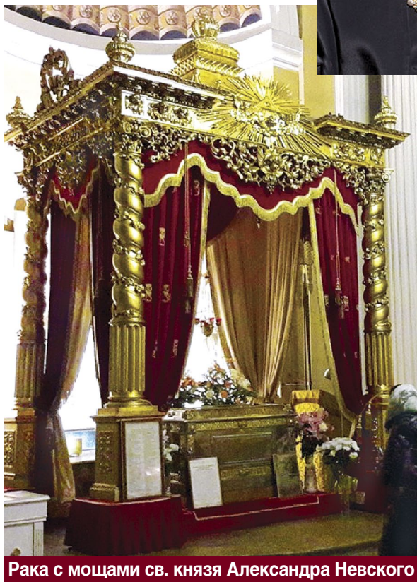
Рака с мощами св. князя Александра Невского

ред святыми мощами проходят строем все роды войск. Масштабы мероприятия настолько значительны, что городские власти перекрывают автомобильное движение на центральной магистрали города – Невском проспекте.