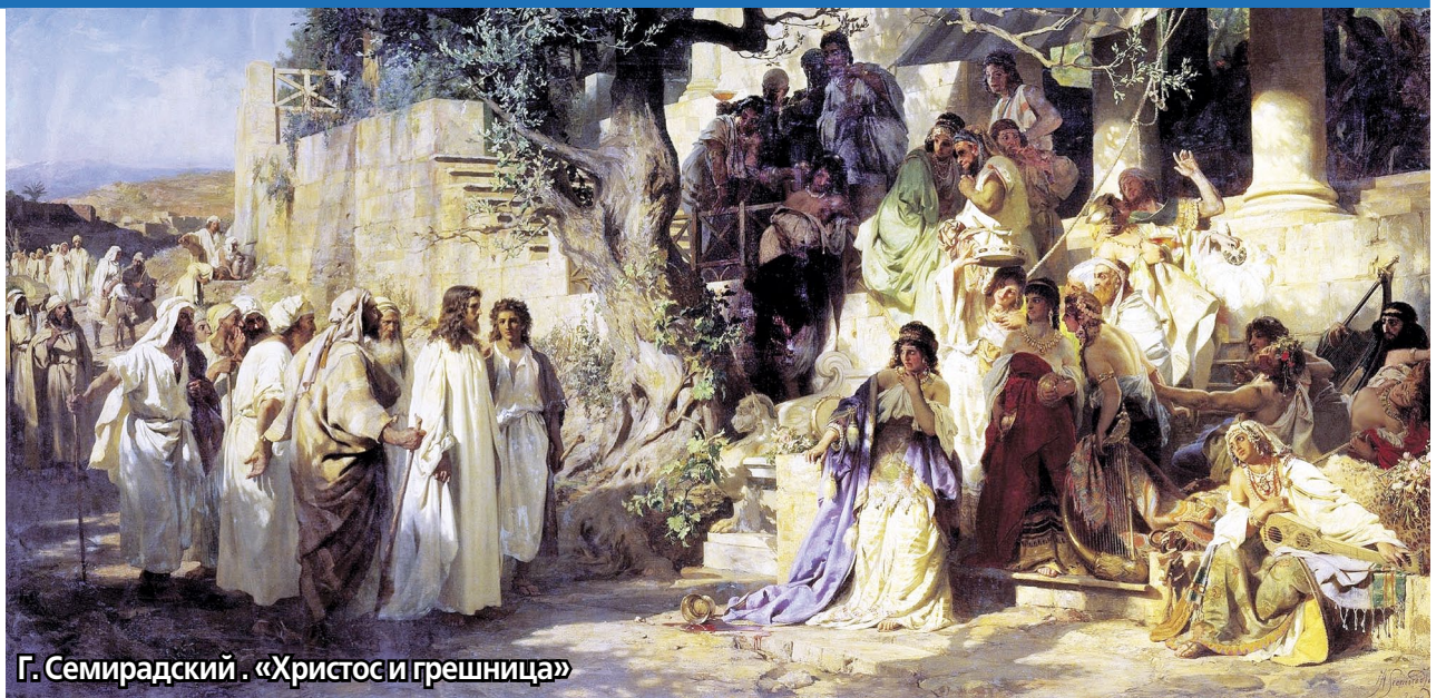
Г. Семирадский. «Христос и грешница»

Поэма "Грешница", сочиненная графом Алексеем Толстым в 1857 году, надолго привлекла к себе внимание русского общества. Композитор П.Чайковский пишет в своем дневнике: «...за чаем вздумал читать Алексея Толстого, и его «Дама-скин» и «Грешница» заставили меня неожиданно пролить много слез». Писатель А.Чехов неоднократно упоминал поэму А.Толстого в своих различных рассказах и пьесах. "Грешница" обрела и художественное воплощение: в 1873 году Г. Семирадский написал картину «Христос и грешница».